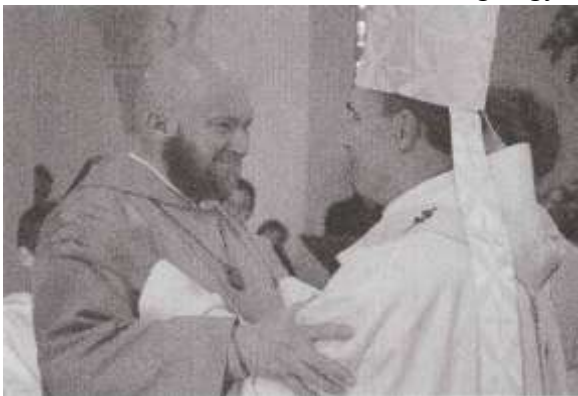
Mons. Robert Le Gall Toulouse metropolita érseke és Yann-Marie kistestvér az 1. egyházi jogi jóváhagyás hálaadó szentmiséjén

A Szeretet-Jézusól nevezett Aratás Kistestvéreinek Monasztikus Testvérisége egy új