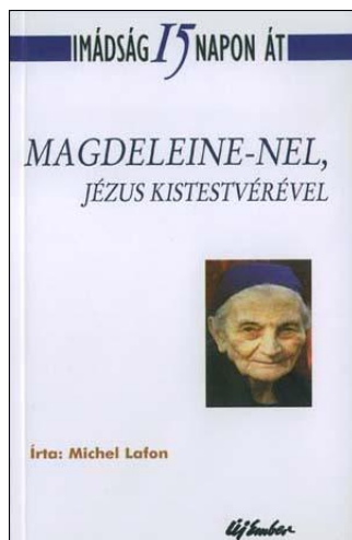
Michel Lafon: Imádság 15 napon át Magdeleine-nel, Jézus kistestvérével , Új Ember Kiadó, Budapest 2011.

Magdeleine Hutin, Jézus kistestvére kevésbé ismert a magyar keresztények körében, pedig a II. Vatikáni Zsinatot követő vallásos élet megújítása terén fontos szerepet töltött be 1946 óta kifejezésre juttatott és kistestvérei által az egész világon megélt intuíciói által. Mindig Charles de Foucauld-ra hivatkozik, tanítványának vallja magát, annyira, hogy Foucauld-t a Kistestvérek Testvérisége atyjának és alapítójának tekinti. A kötetben szereplő szövegeken elmélkedve ismerkedhetnek meg az olvasók Magdeleine kistestvérével, az életéből vett kisebb-nagyobb események felvillantásának segítségével, hogy ezáltal bizonyos szövegeket, idézeteket jobban meg tudjanak érteni. Ezekből az írásokból és Michel Lafon hozzájuk fűzött gondolataiból a mindennapokban megélhető lelkiesség képe bontakozik ki előttünk, melynek ismertetőjegye, hogy a világban való jelenlét, a szegények és elesettek iránti cselekvő könyörület és a bensőséges kapcsolat a Jézus Krisztusban emberré lett Istennel egyszerre jellemzi, s mindenki számára követhető útnak bizonyul.