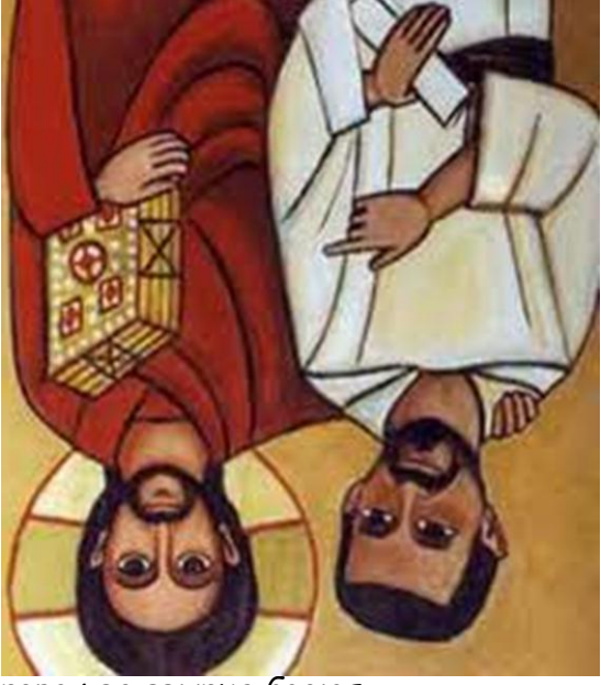
Boldog Charles de Foucauld

Atyám, átadom magamat Neked, tégý velem tetszéd szerint. Bármít teszél is velem, megköszönöm, mindenre kész vagyok, mindent elfogadok, csak akaratod bennem és minden teremtményedben beteljesüljön. Semmi mást nem kívánok Istennem. Kézédbe ajánlom lelkemet, Neked adom Istennem, szívem egész szeretetével, mert szeretlek, és mert szeretetem igényli, hogý egészen Neked adjam át magam, hogý végteleen bizalommal egészen kezédbe helyezzem életemet, mert Te vagy az én Atyám. Ámen